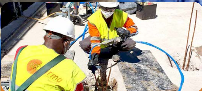
Injecção de resinas Barragem de Matala