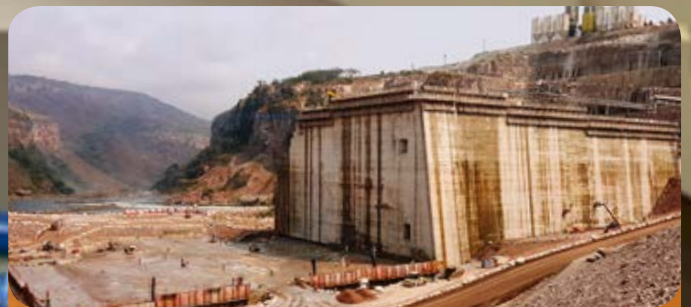
Reforço estrutural e estanqueidade de galerias Laúca