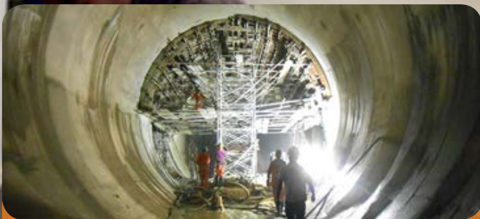
Selagem das vias de águas nos túneis horizontais Barragem do Cambembe

A Política de Qualidade da ECOFIRMA assenta no compromisso da gestão na implementação do Sistema de Qualidade, assim como na melhoria contínua da sua eficácia. O nosso objectivo é satisfazer os requisitos do cliente e as expectativas de todas as partes interessadas. Para tal, a ECOFIRMA está a integrar o processo de certificação de acordo com norma ISO 9001.