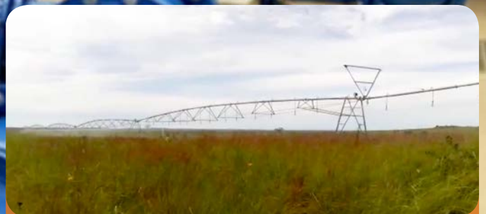
Instalação de sistema de rega por aspersão Vários locais